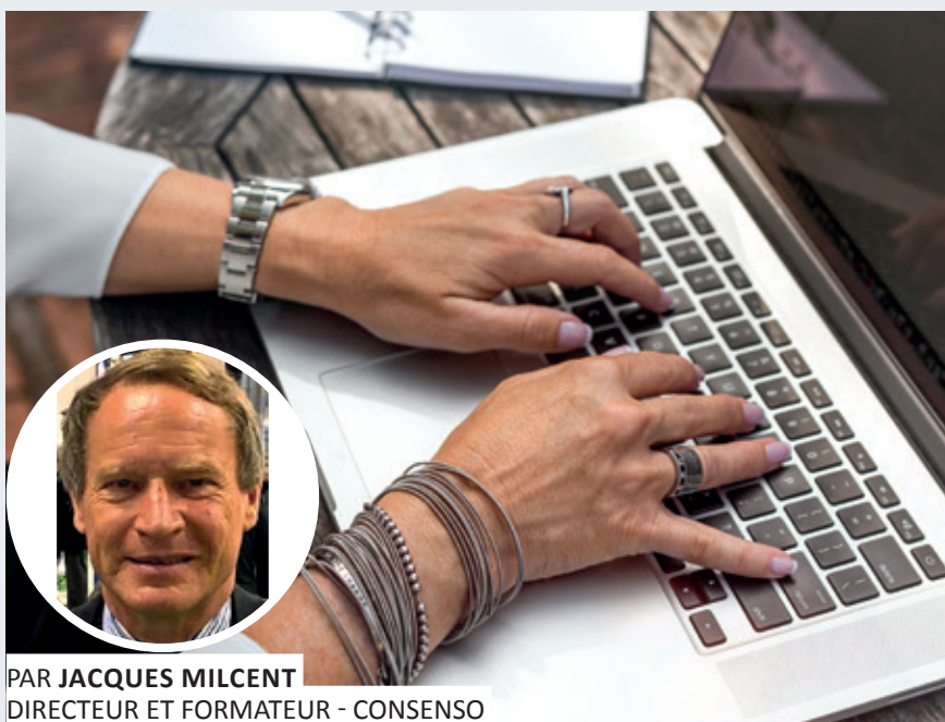
PAR JACQUES MILCENT DIRECTEUR ET FORMATEUR - CONSENSO