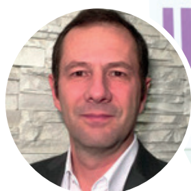
PAR FRÉDÉRIC SEGRETINAT DIRECTEUR COMMERCIAL INTERNATIONAL B2B