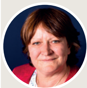
PAR FRANÇOISE BALTÈS DIRECTRICE SERVICE CLIENTS