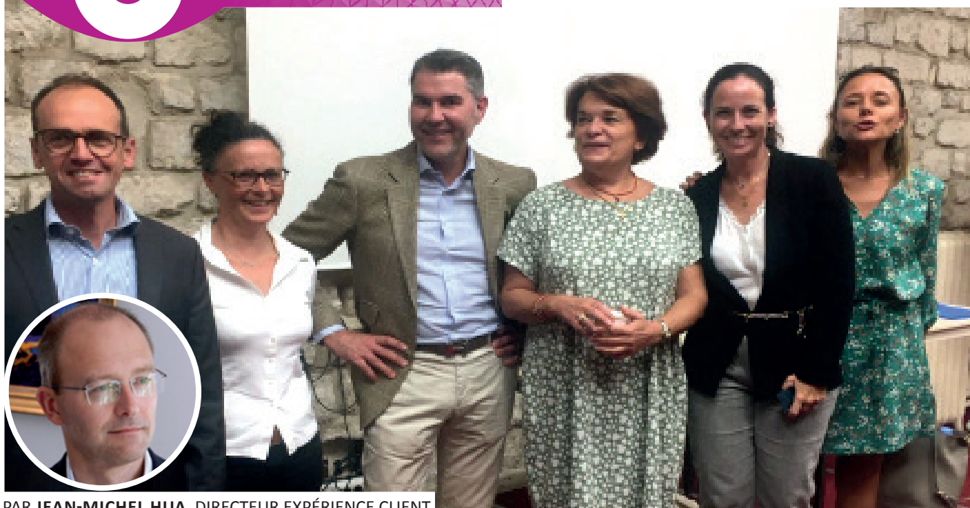
PAR JEAN-MICHEL HUA, DIRECTEUR EXPÉRIENCE CLIENT