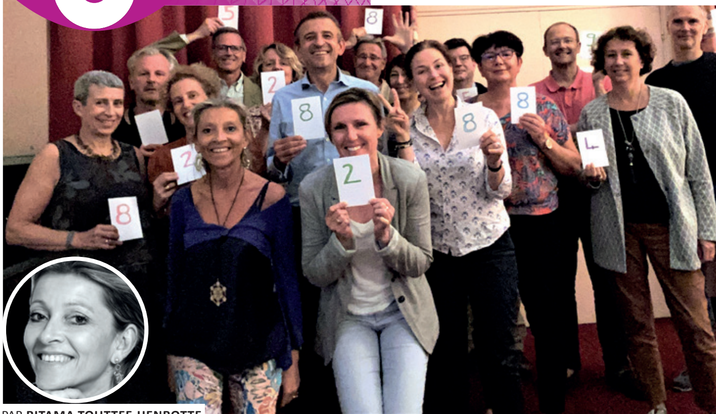
PAR RITAMA TOUTTEE-HENROTTE COACH & THÉRAPEUTE