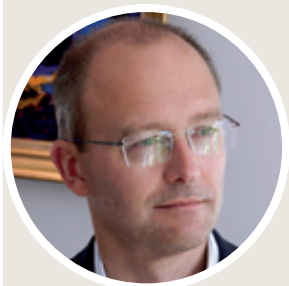
PAR JEAN-MICHEL HUA, DIRECTEUR EXPÉRIENCE CLIENT