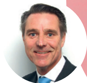
PAR FRANÇOIS PICQUEREY AGENT GÉNÉRAL AXA PRÉVOYANCE & PATRIMOINE