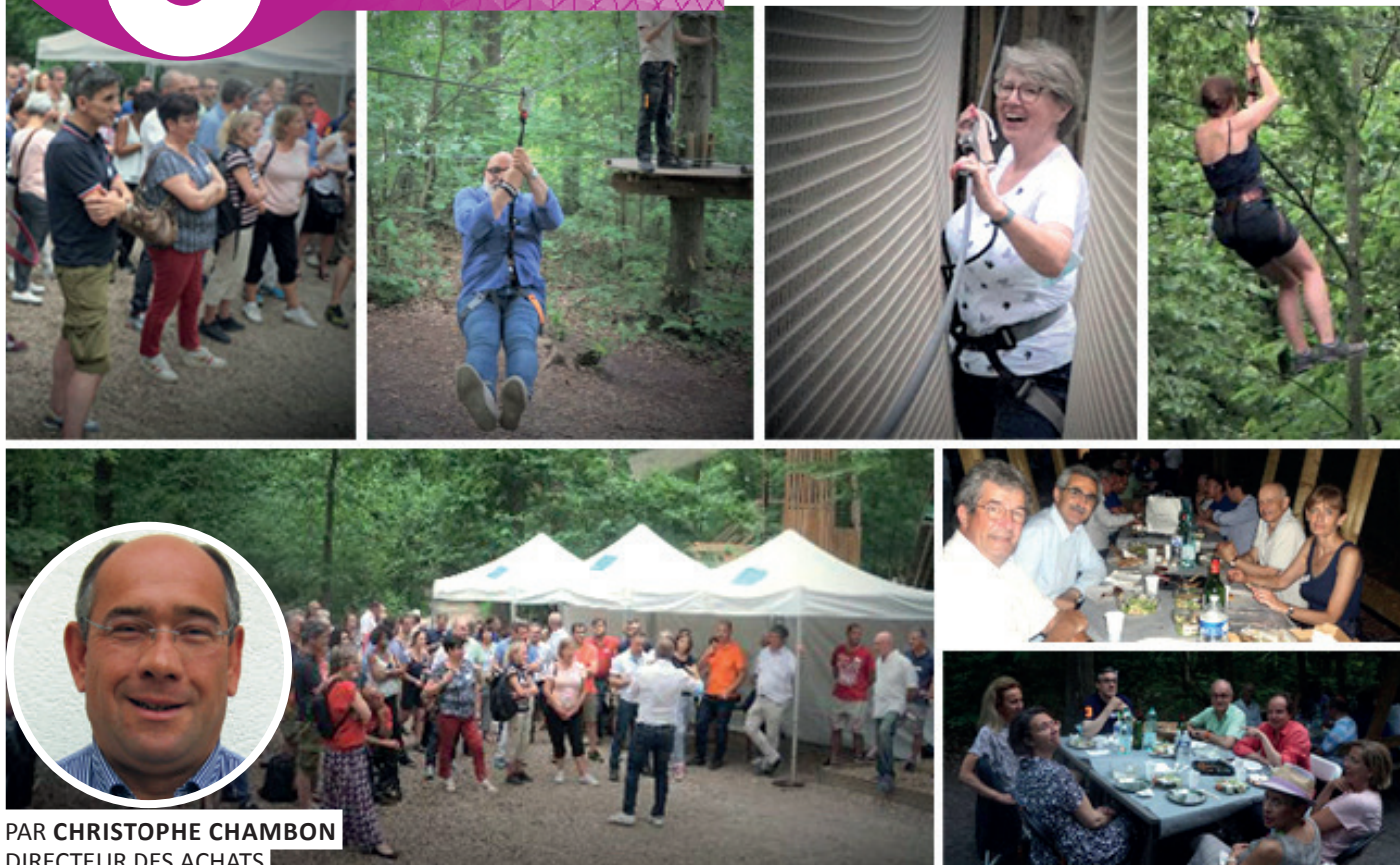
PAR CHRISTOPHE CHAMBON DIRECTEUR DES ACHATS