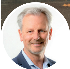
PAR LAURENT LEBOUTEILLER COACH ET CONSULTANT EN FORMATION