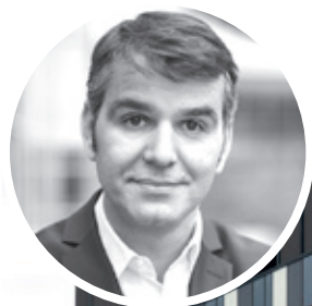
PAR STÉPHANE PEYRÉ DIRECTEUR CAHRA PARIS