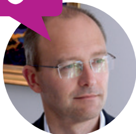
PAR JEAN-MICHEL HUA DIRECTEUR EXPÉRIENCE CLIENT