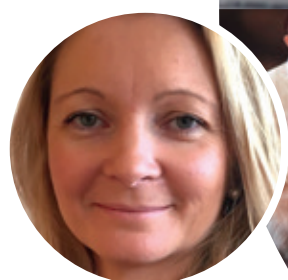
PAR CAROLE CHAUAUX DIRECTRICE MARKETING & COMMUNICATION