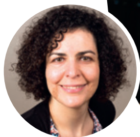
PAR KARINE SAVIGNY CONSULTANTE, FORMATRICE ET COACH INTERNATIONALE