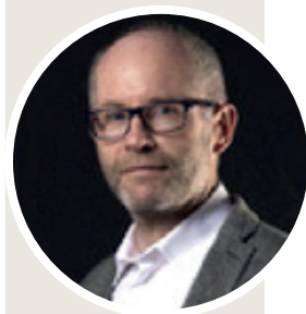
PAR PHILIPPE GRAMOND DIRIGEANT ASSOCIÉ DE CYCONIA