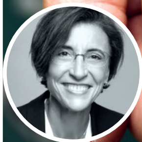
PAR CATHERINE TESTOT

CONSULTANTE EN MANAGEMENT (QVT/PERFORMANCE) ET MANAGER JURIDIQUE DE TRANSITION