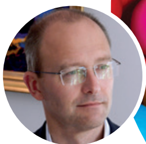
PAR JEAN-MICHEL HUA, DIRECTEUR EXPÉRIENCE CLIENT