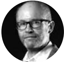
PAR PHILIPPE GRAMOND DIRIGEANT ASSOCIÉ DE CYCONIA