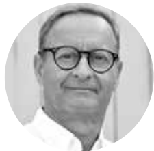
PAR FRANCK HEGELE DIRECTEUR GÉNÉRAL À TEMPS PARTAGÉ