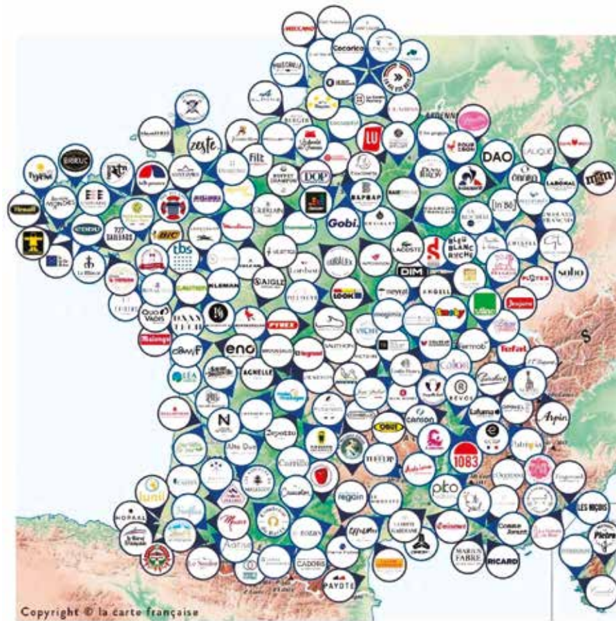
La carte de l'industrie en France.