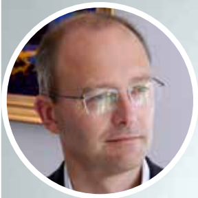
PAR JEAN-MICHEL HUA, DIRECTEUR EXPÉRIENCE CLIENT