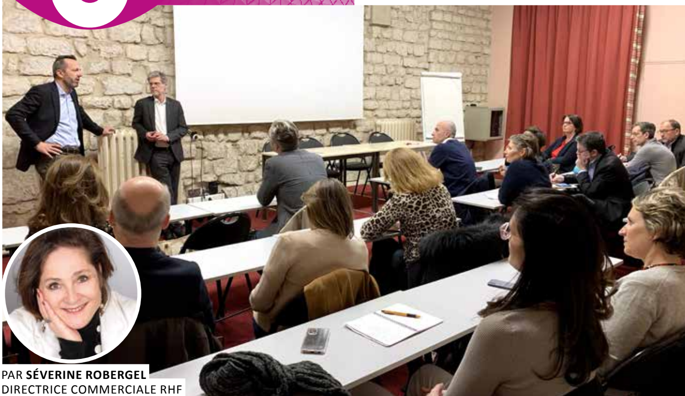
PAR SÉVERINE ROBERGEL DIRECTRICE COMMERCIALE RHF