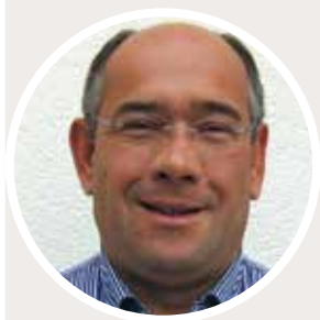
PAR CHRISTOPHE CHAMBON DIRECTEUR DES ACHATS