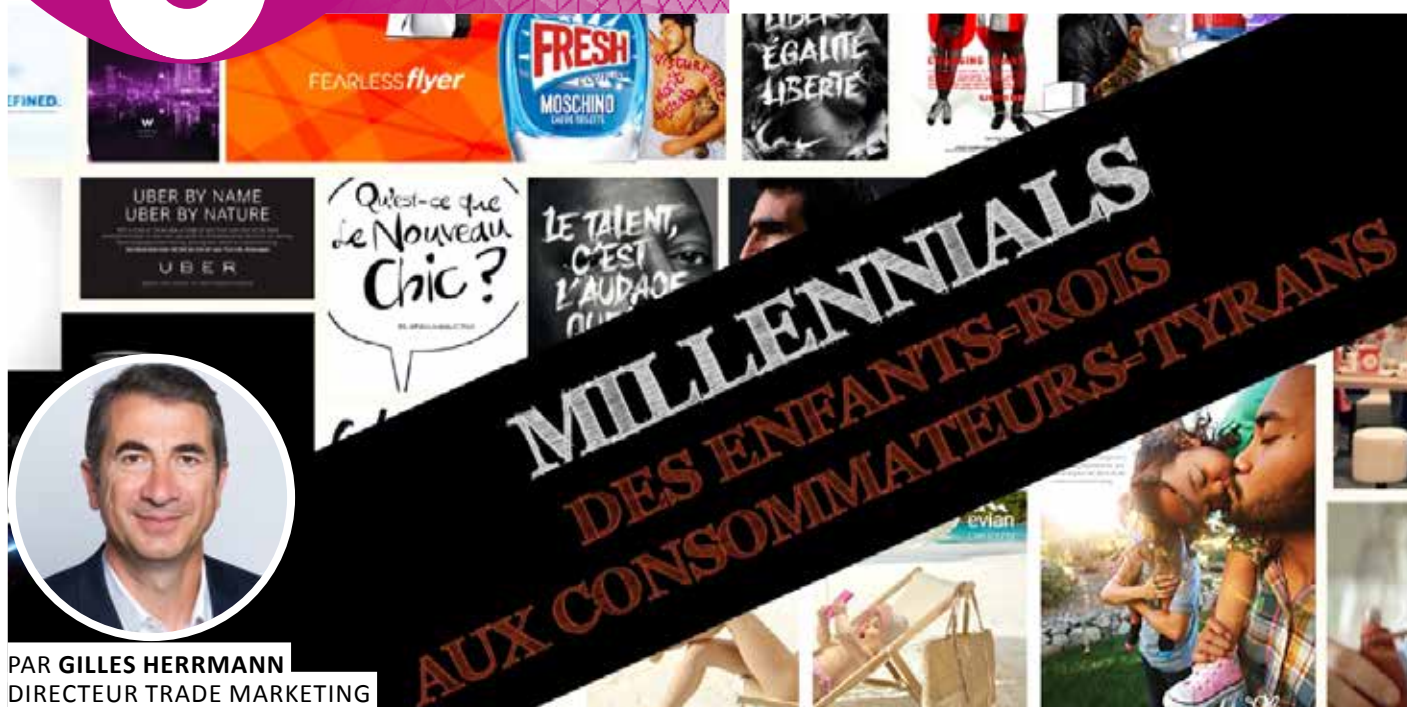
PAR GILLES HERRMANN DIRECTEUR TRADE MARKETING