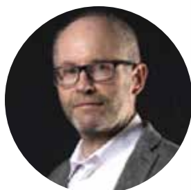
PAR PHILIPPE GRAMOND DIRIGEANT ASSOCIÉ DE CYCONIA